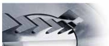
Broșare și mortezare