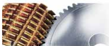
Prelucrarea roților dințate