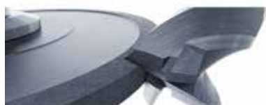
Rectificare și honuire

Pentru a vă recomanda cel mai bun produs, trebuie să cunoaștem aplicația și ce așteptări aveți de la fluidul de tăiere. Contactați-ne, și specialiștii noștri vă vor consilia cu cea mai mare plăcere.